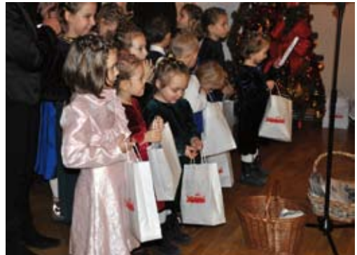
Dzieci z Rajskiej i Żmijcey po raz kolejny złożyły życzenia Małopolskiej „Solidarności”.