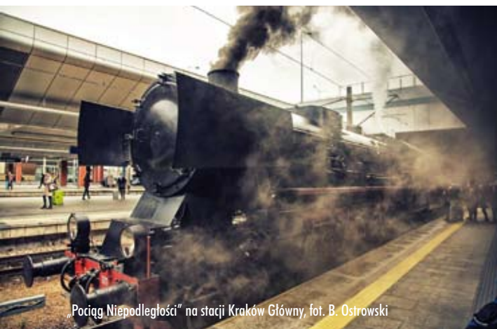
Pociąg Niepodległości” na stacji Kraków Główny, fot. B. Ostrowski

W Krzeszowicach Straż Ochrony Kolei zaprezentowała uczestnikom wydarzenia pokaz sprawności funkcjonariuszy Grup Operacyjno-Interwencyjnych oraz posłuszeństwa psa służbowego a w Trzebini Urząd Transportu Kolejowego przedstawił dzieciom program edukacyjny „Kolejowe ABC”. Dużą popularnością wśród nich cieszył się „Rogatek”, pluszo-