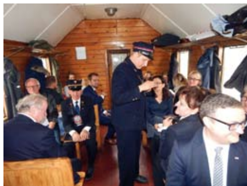
Kontrola biletów specjalnych