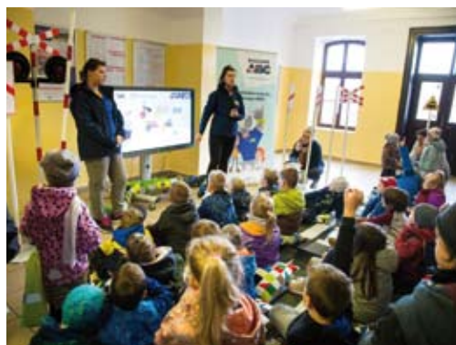
„Kolejowe ABC” przygotowane przez Urząd Transportu Kolejowego w budynku stacji Trzebinia