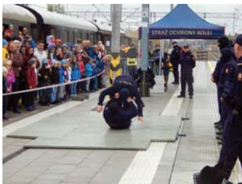
Pokaz sprawności Grup Operacyjno-Interwencyjnych SOK na peronie, w stacji Krzeszowice

Podróżowało nim ponad 200 uczestników w tym 65 dzieci, rodziców i nauczycielki Zespołu Szkolno-Przedszkolnego nr 10 w Krakowie. W trakcie przejazdu organizatorzy rozprowadzali słodycze i batony „7days” oraz napoje przekazane przez Spółkę „Wars”. Świadcami wydarzenia w Trzebini byli też jej mieszkańcy, którzy licznie przybyli na stację kolejową wraz z dziećmi.